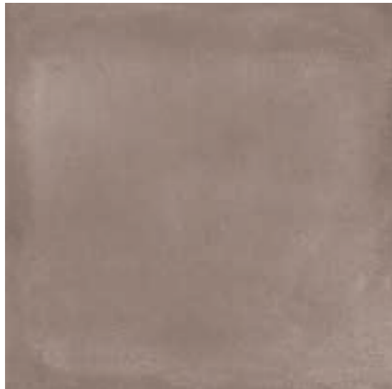
R4EL Rewind XT20 Argilla R4HR Rewind XT20 Argilla rettificato 60x60