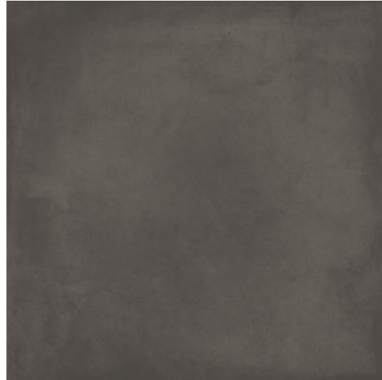
R4EK Rewind XT20 Peltro R4HQ Rewind XT20 Peltro rettificato 60x60