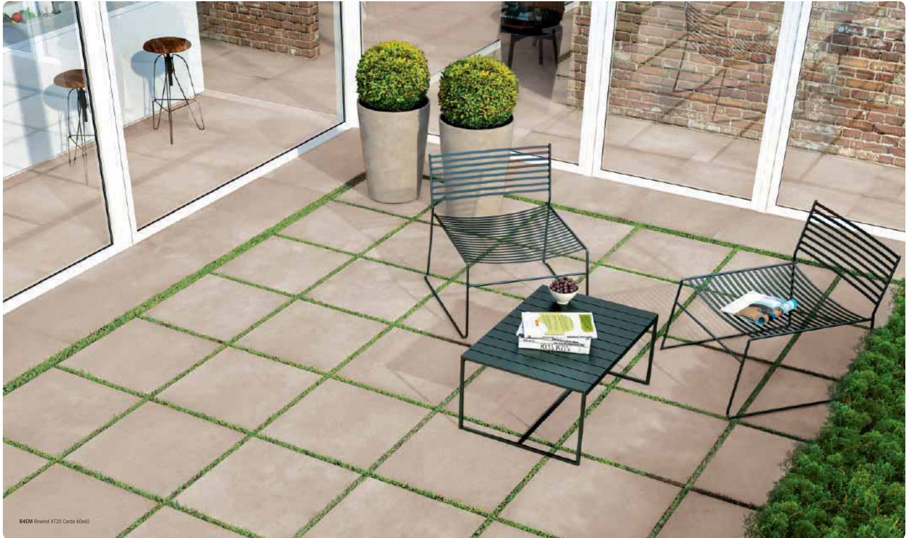
R4EM Rewind XT20 Corda 60x60

gres fine porcellanato colorato in massa