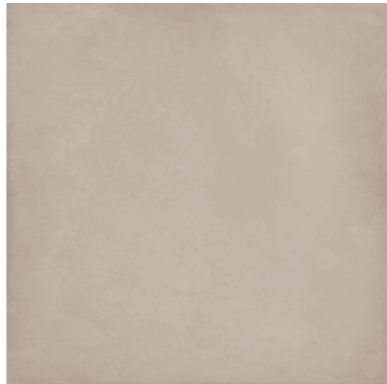
R4EM Rewind XT20 Corda R4HS Rewind XT20 Corda rettificato 60x60